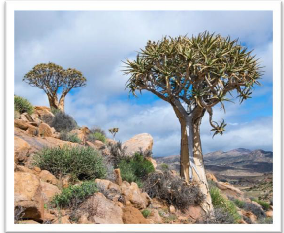
Aloebäume in der Wüste

(Im modernen Hebräisch wird אָהֶל als Mesembryanthemum 8 übersetzt. Es handelt sich um eine einjährige Pflanze aus der Familie der Asteraceae.)